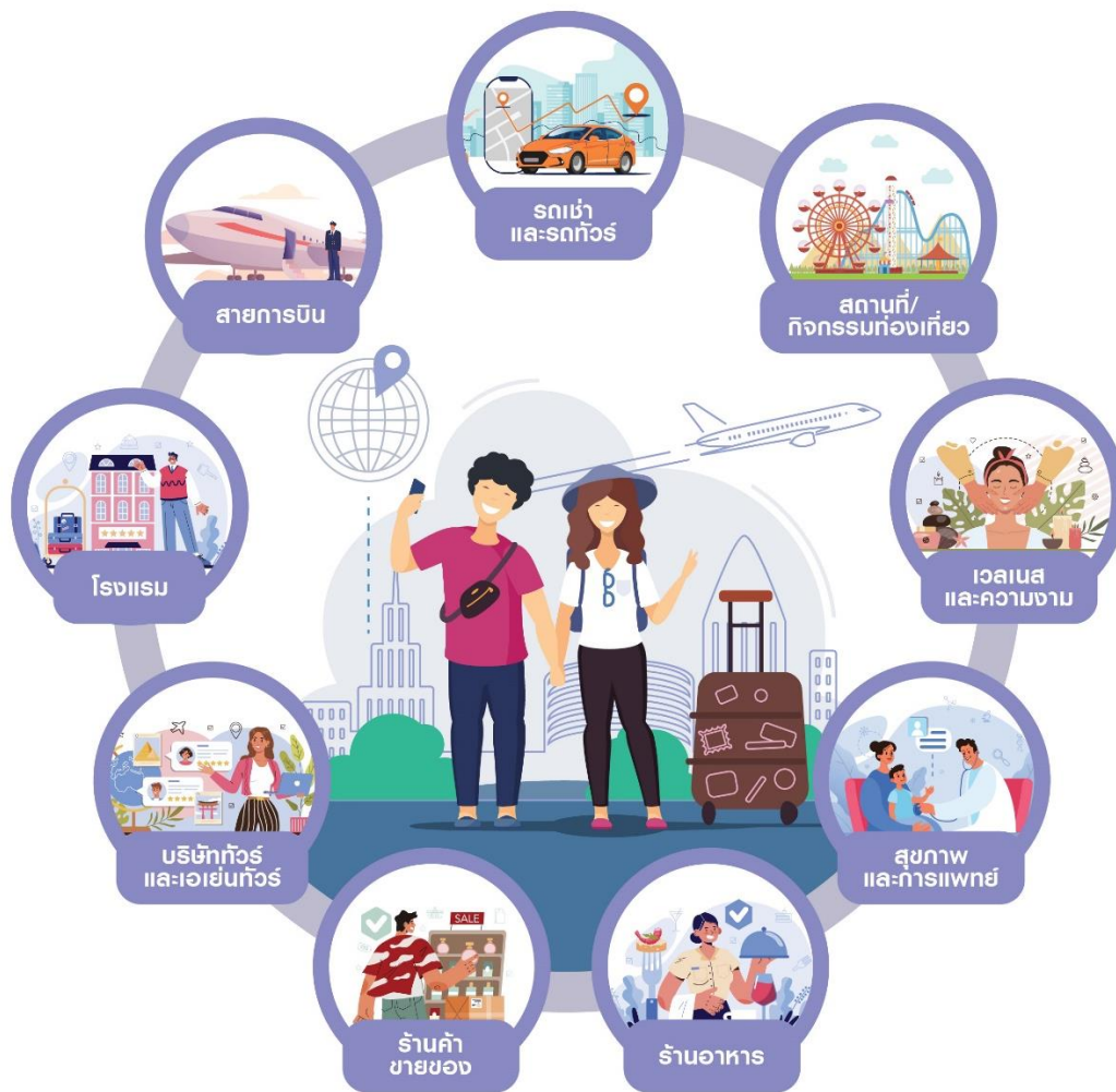
รูปที่ 2 : Tourism ecosystem ที่ได้รับอานิสงส์การฟื้นตัวของนักท่องเที่ยวต่างชาติ